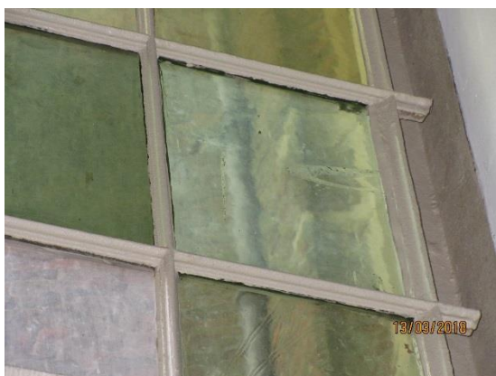
De hoge ramen aan de zuid- en oostzijde van de kerk.

Stibema heeft samen met restauratie-architect GAJ|VBW Architecten een restauratieplan opgesteld. De zuidgevel en de oostzijde worden in de steigers gezet waarna alle aansluitingen tussen de natuursteen onderdelen en de glas-in-loodramen worden beoordeeld en waar nodig hersteld.